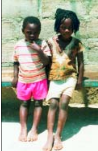
Waisenkinder aus der Pfarrei

Das Mädchen auf dem Titelfoto lässt sich nicht entmutigen, auch wenn sie nicht gerade im Schlaraffenland lebt: Chunga ist ein Vorort von Lusaka mit einer Bevölkerung von rund 60 000 Menschen und denkbar schlechter Infrastruktur. Es gibt dort keine sichere Wasserversorgung, kein Telefon, und vor allem keine Krankenhäuser. Die Abwasserleitungen sind oft schadhaft, was zur Ausbreitung von ansteckenden Krankheiten führt. Die Wege erinnern eher an frischgepflügte Felder und sind während der