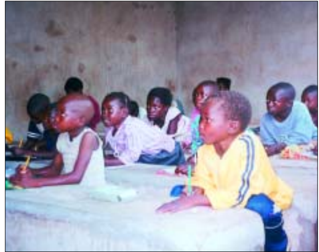
Der Unterricht findet auf Zementbänken statt

Ihnen sehr dankbar. Auf Ihrer Überweisung bei der Liga-Bank Würzburg (BLZ 750 903 00) Kto.-Nr. 3 017 605 geben Sie bitte als Stichwort "Chunga" an, damit Ihre Spende in voller Höhe weitergeleitet werden kann. Für weitere Fragen steht Ihnen die Missionsprokura in Würzburg gerne zur Verfügung. Auch werden Sie über den weiteren Verlauf des Projektes in der Zeitschrift „Mariannahill“ sowie auf der Internetseite „ http://www.mariannahill.de “ auf dem Laufenden gehalten. Ein herzliches Vergelt's Gott sagen Ihnen schon jetzt die Missionare von Mariannahill.