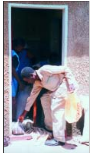
Helfer verteilen Lebensmittel

Liebe Freunde der Missionare von Mariannahill, wenn Sie die Pfarrei St. Stephen in Chunga mit ihren vielfältigen sozialen Projekten unterstützen wollen, wären wir