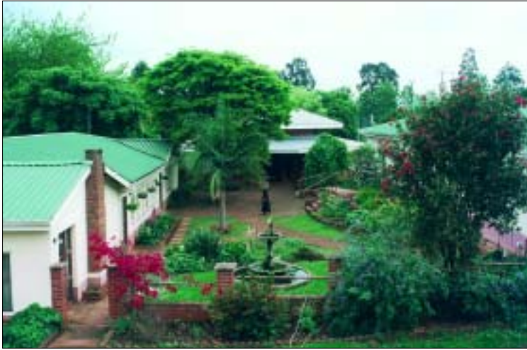
Das "Abbot Francis House" in Merrivale

Francis House (Abt-Franz-Haus) in Merrivale. Momentan bereiten sich dort 31 junge Männer auf ihren Dienst an den Menschen vor. Die Studenten kommen aus 14 verschiedenen Ländern – wirklich eine internationale Studiengemeinschaft.