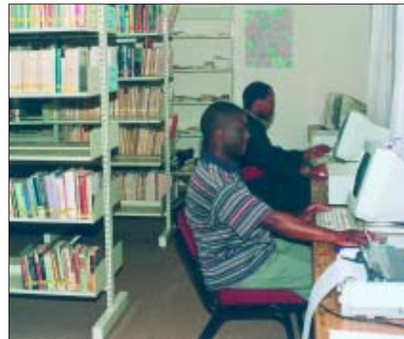
Unsere Studenten beim Studium in der Bibliothek

Mit dem Eintritt alleine ist es natürlich nicht getan. Auf die jungen Ordensleute warten schwierige Aufgaben. Die Seelsorge ist überall auf der Welt eine Herausforderung für die Geistlichen. Daneben müssen die Patres und Brüder in Afrika aber auch in der Lage sein, Menschen zu helfen, die in Armut und Hunger leben sowie an Aids oder anderen ansteckenden Krankheiten leiden. Immer mehr müssen diese Mitbrüder die Aufgaben übernehmen, die zuvor von den europäischen Missionaren erledigt wurden. Um ihren Beruf gut ausüben zu können, brauchen unsere Mitbrüder unbedingt eine gute und qualifizierte Ausbildung. Diese Ausbildung erhalten sie im Abbot