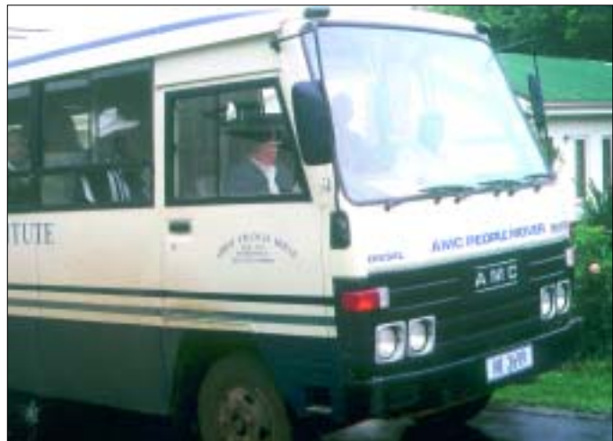
Dieser Kleinbus wurde unseren Studenten gestohlen