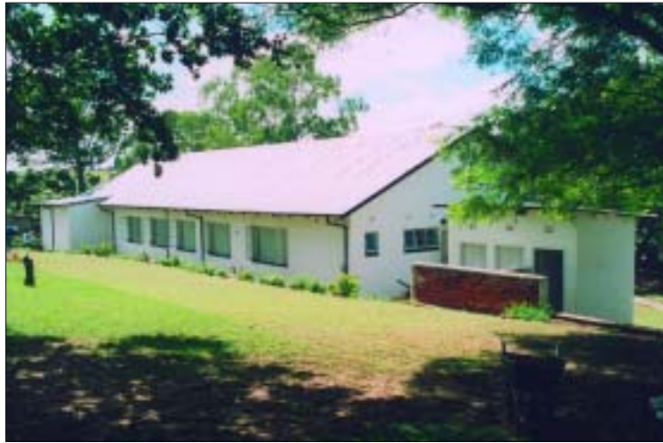
Die St. Anthony's Klinik in Badplaas

Die St. Anthony's Klinik in Badplaas im Bistum Witbank, Südafrika, konnte am 13. Januar dieses Jahres unter katholischer Leitung wiedereröffnet werden. Diese Klinik ist ein Geschenk des Himmels für die 11 000 Einwohner von Badplaas. Denn die nächsten beiden Krankenhäuser befinden sich in einer Entfernung von ca. 30 km, und ein mobiler Gesundheitsdienst für die arme, ländliche Umgebung konnte bisher jedes Gebiet nur einmal monatlich besuchen. Die Arbeitslosigkeit ist hoch, Krankheiten wie Unterernährung bei Kindern, Krätze, Tuberkulose und Bilharziose gehören zu den verbreitetsten Krankheiten. Oft sind diese und ähnliche Erkrankungen auch Begleiterscheinungen von HIV/AIDS. Vermutlich sind viele Menschen mit dem HIV-Virus infiziert.