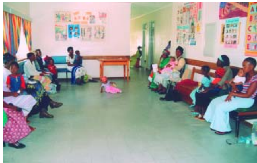
Mütter warten mit ihren Kindern auf die Behandlung

Erfreulicherweise werden jetzt schon täglich 60 bis 70 Patienten behandelt. Liebe Missionsfreunde, mit Ihrer Spende können sie mithelfen, dass die arme Bevölkerung von Badplaas auch in Zukunft eine medizinische Grundversorgung erhält, und dass diese noch verbessert werden kann. Geben sie auf Ihrer Überweisung bei der Liga-Bank Würzburg (BLZ 750 903 00) Kto.-Nr. 3 017 605 bitte als Stichwort „Badplaas“ an, damit wir Ihre Spende in voller Höhe weiterleiten können. Für weitere Fragen steht Ihnen die Missionsprokura in Würzburg gerne zur Verfügung. Auch werden Sie über den weiteren Verlauf des Projektes in der Zeitschrift „Mariannahill“ sowie auf der Internetseite http://www.mariannahill.de auf dem Laufenden gehalten. Schon jetzt sagen Ihnen die Missionare von Mariannahill ein herzliches „Vergelt's Gott“.