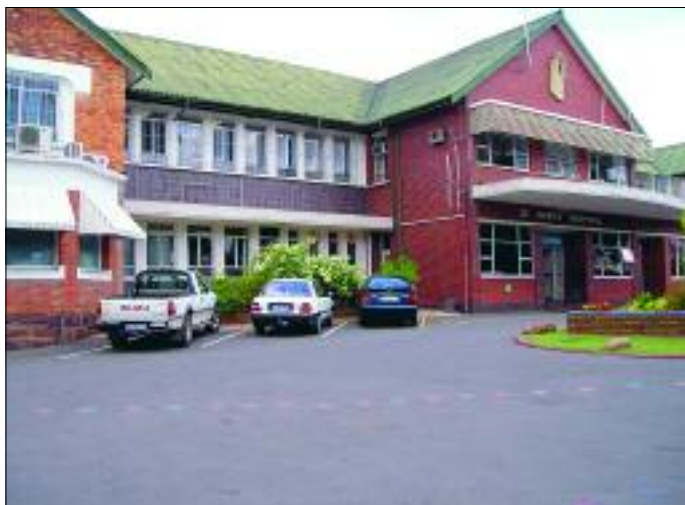
Das Krankenhaus St. Mary's in Mariannahill, Südafrika

Die AIDS-Klinik iThemba (Hoffnung) am St. Mary's Krankenhaus in Mariannahill, Südafrika