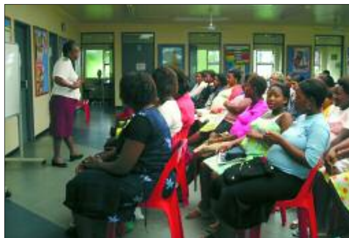
Werdende Mütter werden medizinisch beraten

Bis jetzt hat die AIDS-Klinik iThemba, die zum Krankenhaus St. Mary's gehört, 750 Patienten behandelt und hält damit den Rekord in Südafrika. Dies wurde durch finanzielle Unterstützung der US-Regierung ermöglicht. Aber es sind noch viel mehr Kranke, die nach Mariannahill kommen und darauf warten, dass ihnen geholfen wird. Das Krankenhaus hat die nötige Infrastruktur und ausgebildetes Personal, um zu helfen. Unter anderem ist es das einzige katholische Krankenhaus mit Schwesternpflegeschule in Südafrika. Aber um die Hilfsmaßnahmen auch finanzieren zu können, ist man auf die Großzügigkeit von Spendern wie Ihnen angewiesen.