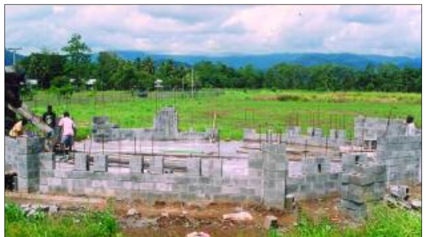
Dank Ihrer Spenden konnte mit dem Kirchenbau fortgefahren++++ werden

In unserem Freundesbrief zu Weihnachten letztes Jahr haben wir Sie um Spenden für den Kirchenbau der katholischen Hochschulgemeinde in Lae gebeten. Dank Ihrer Spendenfreudigkeit konnten wir unseren Mitbrüdern in Papua Neuguinea das Rekordergebnis von mittlerweile 111 962, 33 Euro überweisen. Im Namen der Mitbrüder und der Hochschulgemeinde in Lae sagen wir Ihnen ein herzliches „Vergelt's Gott!“